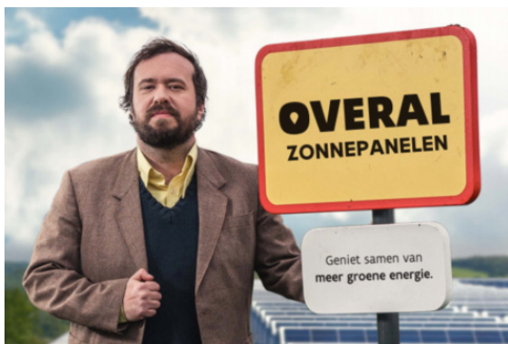
Vlaanderen: campagne stroomversneller.be