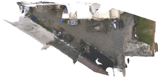
Fly-through door de locatie

van het gebouwencomplex is daar een voorbeeld van: