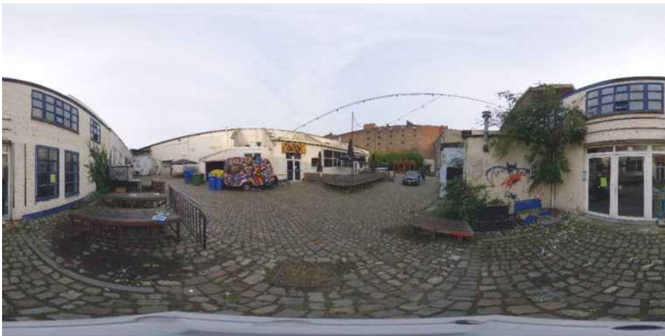
360-graden foto's van het Recyclart gebouwencomplex

De foto's werden vervolgens verwerkt tot digitaal gebouwmodel door middel van fotogrammetriesoftware. Eenmaal ingesteld verwerkt de software de foto's via verschillende tussenstadia automatisch tot een fotorealistisch 3D-model. De tijd die nodig is voor de verwerking is sterk afhankelijk van het aantal foto's en van de snelheid en het werkgeheugen van de gebruikte pc. Voor de software zijn zowel gratis open source als betaalde professionele oplossingen beschikbaar. De basisfunctionaliteit van beide typen oplossingen is hoofdzakelijk hetzelfde. Het verschil zit met name in het feit dat professionele oplossingen veelal een meer geavanceerde functionaliteit en een gebruiksvriendelijkere interface hebben. Daarnaast zal afhankelijk van het type omgeving de kwaliteit van het genereerbare digitale model hoger zijn.