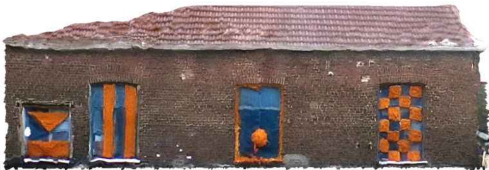
Façades geëxtraheerd uit het digitale gebouwmodel