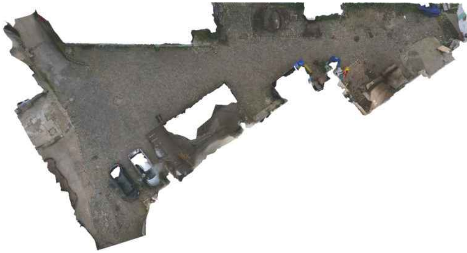
Grondoppervlak van het digitale gebouwmodel

Zoals blijkt uit de bovenstaande resultaten kan met 360-gradenfoto's en fotogrammetrie de buitenkant van een gebouwencomplex snel worden vastgelegd en semiautomatisch verwerkt tot een digitaal model. De kwaliteit van het model varieert: deze is relatief hoog voor die delen die van dichtbij zijn gefotografeerd en/of die veel detail bevatten. Het grondoppervlak van de kasseien is daar een goed voorbeeld van. De kwaliteit van verderaf staande gebouwen of delen met minder details is lager. Of het gebruik van 360-gradenfoto's een goede optie is, hangt af van het belang van de snelheid, het gebruiksgemak en de betaalbaarheid van deze methode, waarbij de kwaliteit op de tweede plaats komt. Wil men in het bijzonder voor omgevingen met minder details toch fotogrammetrie gebruiken om de omgeving in 3D te reconstrueren, dan ligt het gebruik van een professionele fotocamera meer voor de hand, gezien deze foto's neemt met een hogere resolutie en dus meer kleine details capteert.