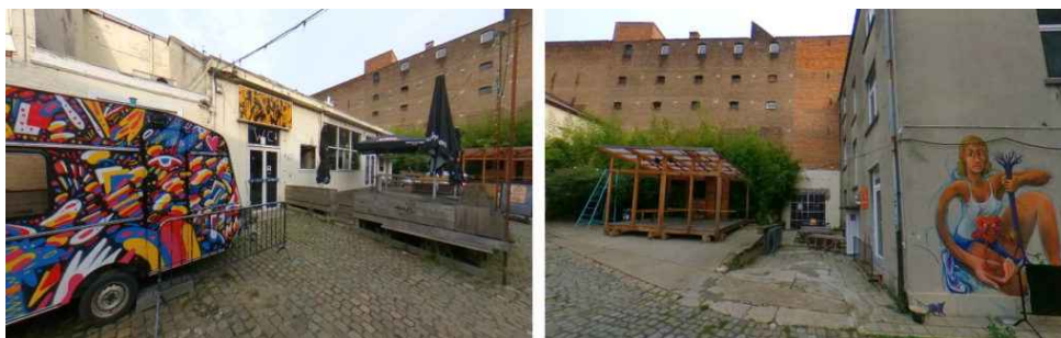
Gebouwencomplex Recyclart in Sint-Jans-Molenbeek waar de case werd uitgevoerd

Dit zijn enkele situatiefoto's van het gebouwencomplex dat voor deze case werd gedigitaliseerd: