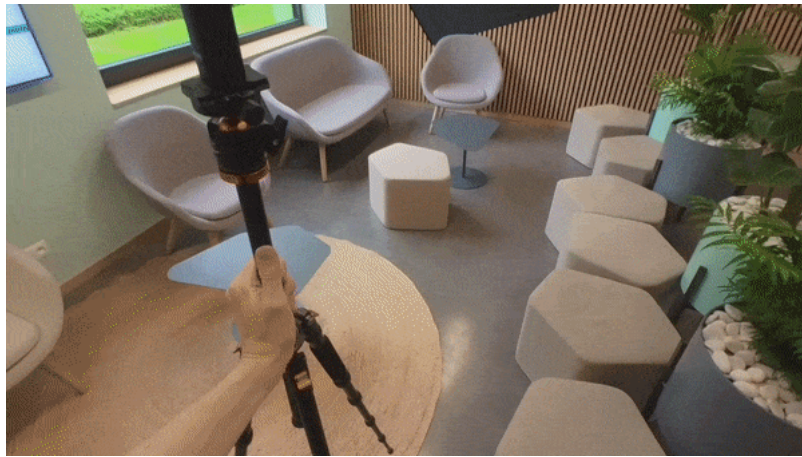
Opname van omgeving op 360-graden foto

Naast reguliere camera's kunnen ook 360-gradencamera's worden ingezet voor het maken van digitale gebouwmodellen op basis van fotogrammetrie. Het gebruik van 360-gradencamera's heeft het voordeel dat er minder foto's nodig zijn om alles vast te leggen en men dus potentieel sneller en met minder moeite de benodigde deliverable in handen heeft. Deze methode heeft echter ook nadelen. Als een 360-gradenfoto met een normale fotoviewer wordt bekeken is er boven en onder in het beeld sterke vervorming zichtbaar doordat deze bedoeld zijn om bolvormig weergegeven te worden. Deze vervorming moet softwarematig worden gecorrigeerd. Daarnaast zullen tien reguliere foto's van dezelfde omgeving meer detail geven dan één 360-gradenfoto, simpelweg omdat elke camera een maximale resolutie (mate van detail) per foto heeft. De keuze voor het gebruik van reguliere foto's of 360-gradenfoto's is daarom genuanceerd: voor een hoge kwaliteit gebruikt men beter een reguliere camera. Als snelheid primeert zijn 360-gradencamera's dan weer net interessanter. In het volgende gedeelte kijken we hoe fotogrammetrie op basis van 360-gradenfoto's kan worden toegepast om snel een digitaal gebouwmodel te maken.