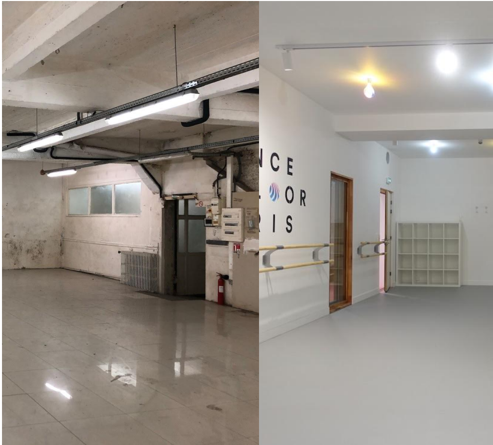
Avant-après © Louise Morin Architecte