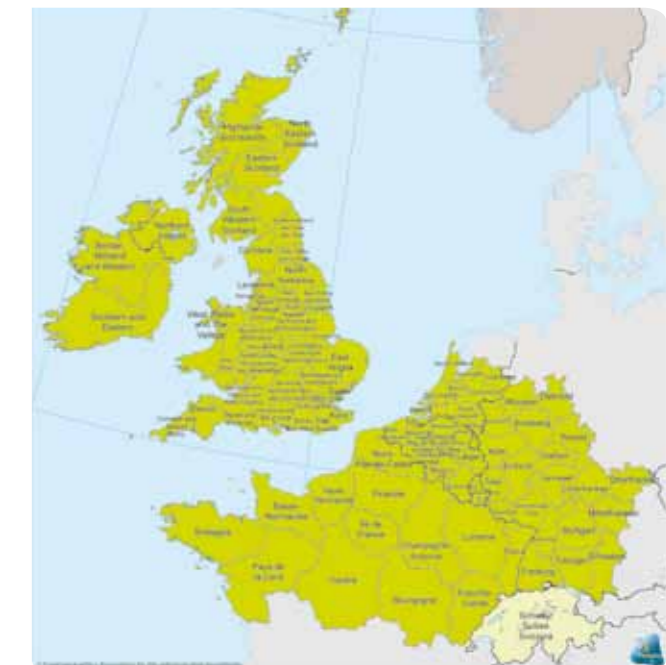
Structuurfondsen 2007-2013: Transnationale samenwerkingsgebieden Noordwest-Europa

De resultaten van projecten moeten duidelijk, vastomlijnd en meetbaar zijn. Met andere woorden: tastbare resultaten (van acties, pilot-investeringen, business cases, scenario's e.d.) moeten waarborgen dat projecten concreet, specifiek en langetermijngericht zijn.